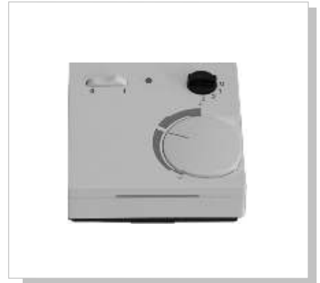
mit Potentiometer, LED, Dreh- und Wippschalter