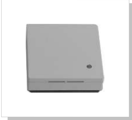
Standardgehäuse aus Kunststoff